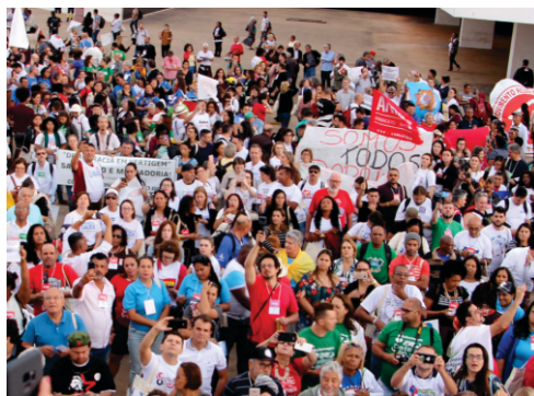
Movimentos sociais na defesa do SUS.

O eixo debaterá o momento do SUS como expressão política do direito humano à saúde e exercício da cidadania, amparado nos seus princípios e diretrizes fundamentais que são basilares do estado democrático de direito, buscando identificar avanços e retrocessos nos 34 anos do Sistema.