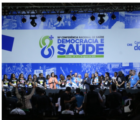
Encerramento da 16ª Conferência Nacional de Saúde, em 2019.

paritária, as delegadas e os delegados que participarão das conferências estaduais. A partir das discussões realizadas nas três etapas da Conferência Nacional de Saúde são definidas diretrizes a serem incorporadas nos Planos