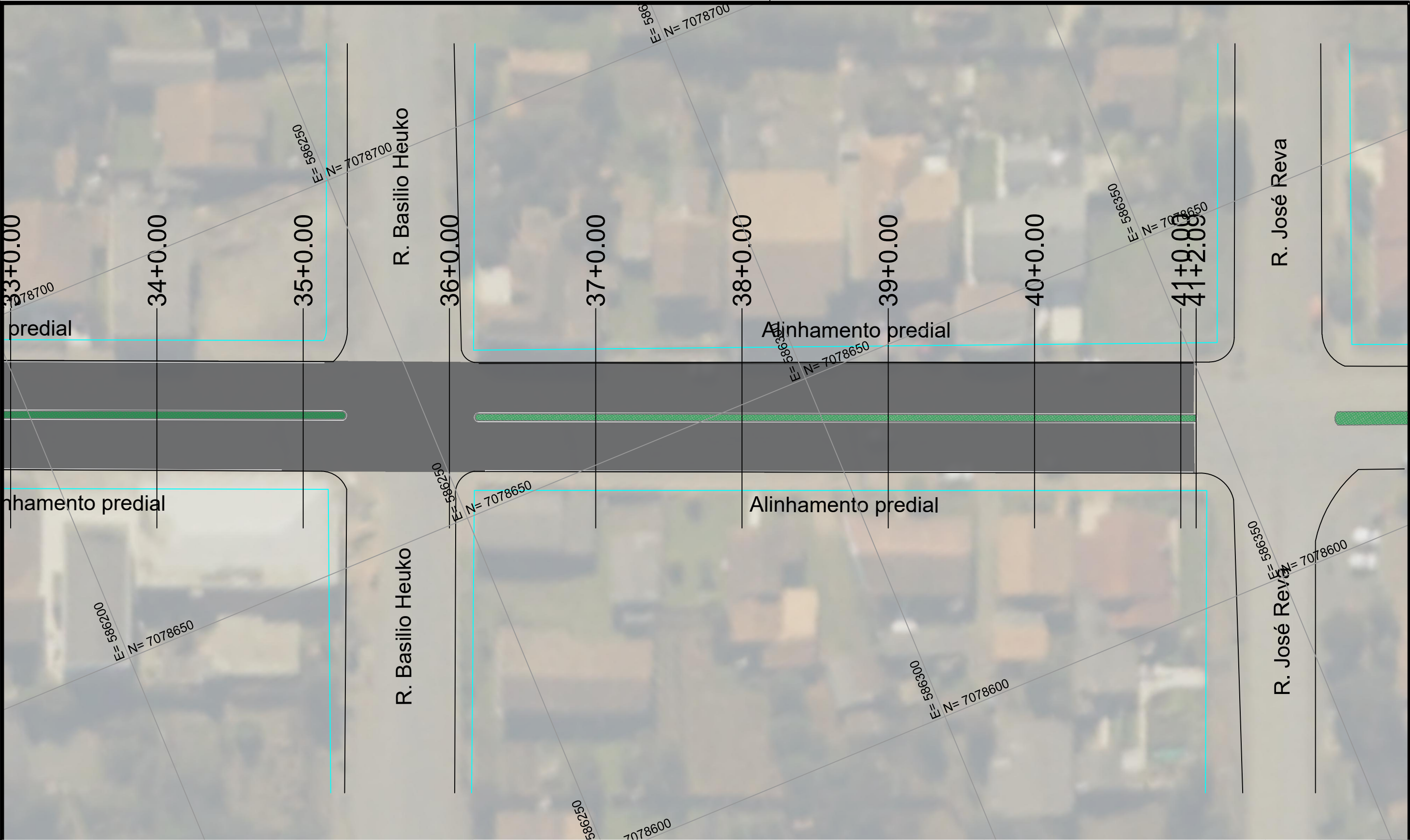
SEÇÃO TÍPICA DA VIA - SEM ESCALA