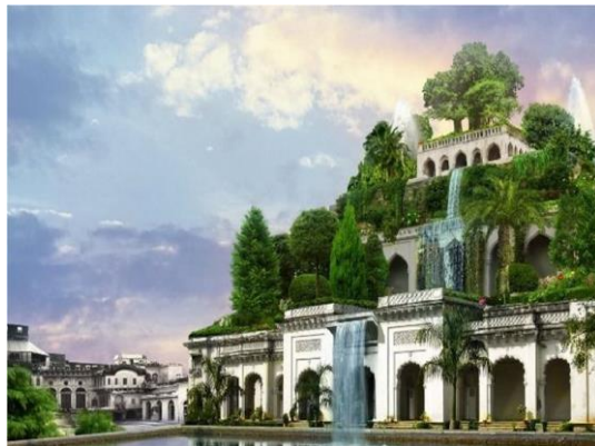
Imagem de um jardim suspenso.

→ Caldeus: Os caldeus, conhecidos como neobabilônicos, constituíram o Segundo Império Babilônico ao conquistar a Mesopotâmia dos assírios em 612 a.C. O império formado pelos caldeus foi extremamente curto e, nesse período, Nabucodonosor foi seu principal rei. Atribui-se a Nabucodonosor o feito de ter ordenado a destruição de Jerusalém e de ter promovido grandes construções na cidade da Babilônia. Entre as construções mais conhecidas da Mesopotâmia, e atribuídos ao reinado de Nabucodonosor, estavam os Jardins Suspensos da Babilônia. Os Jardins Suspensos da Babilônia são considerados uma das sete maravilhas do mundo antigo, porém, muitos historiadores questionam sua existência pelo fato de não haver indícios arqueológicos e registros escritos sobre essa construção além dos registros feitos pelos gregos. Após a morte de Nabucodonosor, o domínio dos caldeus entrou em decadência, e esse povo foi conquistado pelos persas, liderados por Ciro II em 539 a.C.